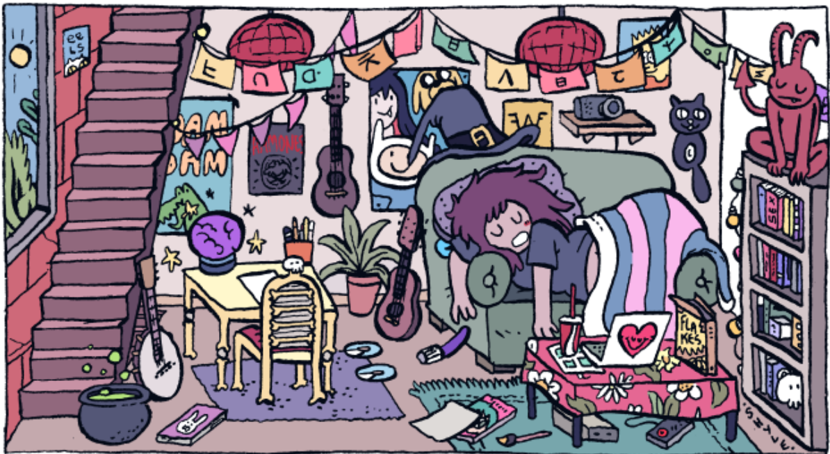
Shyle Zalewski @superalienninja