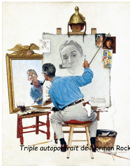
Triple autoportrait de Norman Rockwell