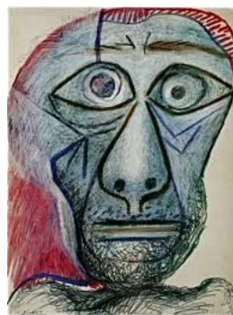
Picasso, Autoportrait (1972)