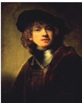
Rembrandt, Autoportrait (1634)

Observe attentivement ces quatre tableaux puis réponds aux questions s'y rapportant.