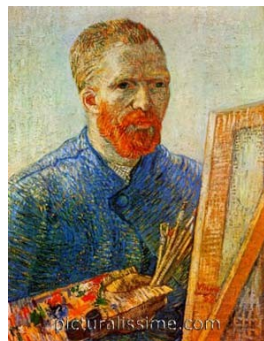
Van Gogh, Autoportrait au chevalet (1888)