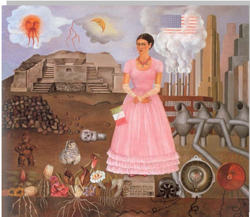
Frida Kahlo, Autoportrait à la frontière entre le Mexique et les Etats-Unis , 1932, huile sur métal, 31x35 cm, New York, collection Manuel Reyero

Observe cette toile et réfère-toi à la fiche-outil « Lecture de l'image » de la page 14.