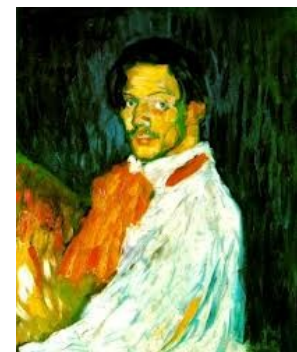
Picasso, Autoportrait à la palette (1906)