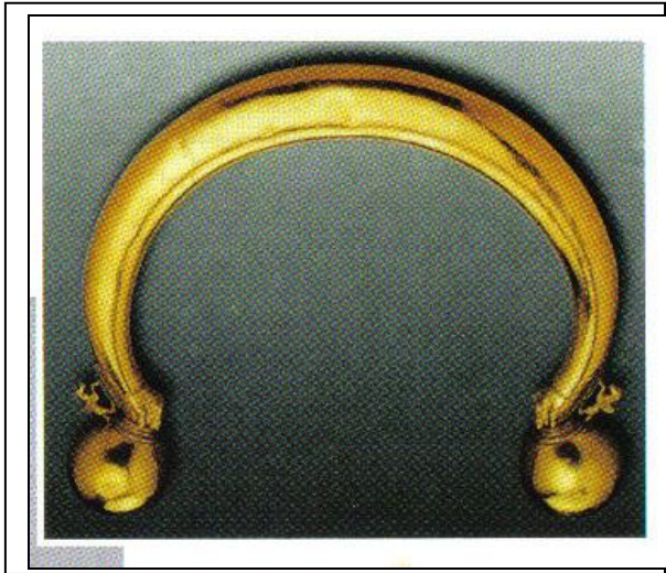
Document 3 : Parure de la dame de Vix, en Gaule, VI ème siècle