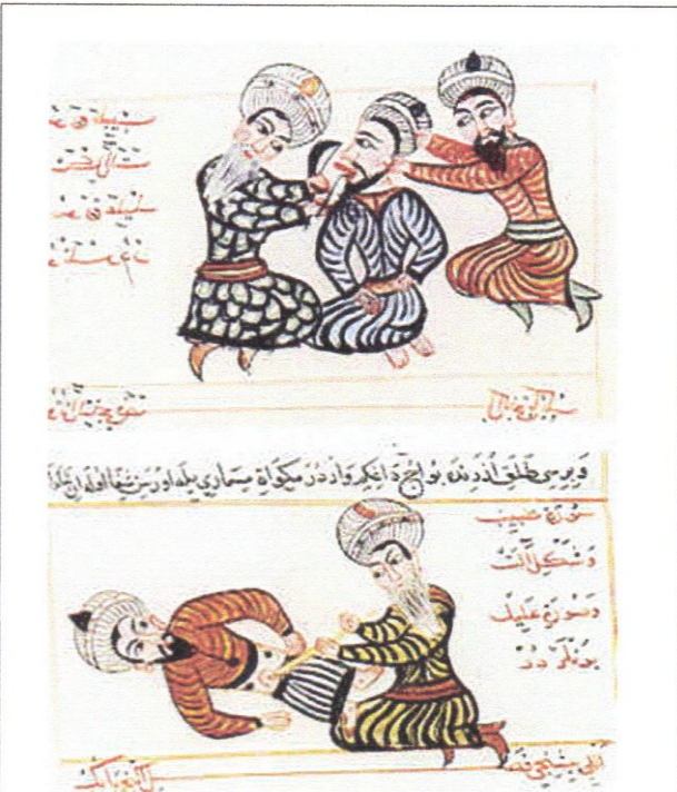
Traité de chirurgie de Charaf ed-Din, 1465, BNF.