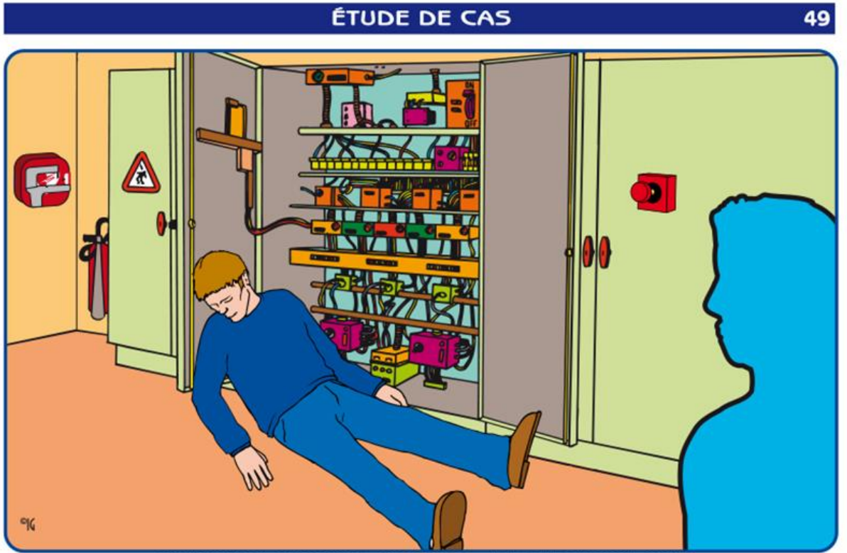
Tél. 03 20 96 97 93 - Fax. 03 20 90 35 35 - Reproduction interdite (Loi N° 94-102 du 05/02/94)