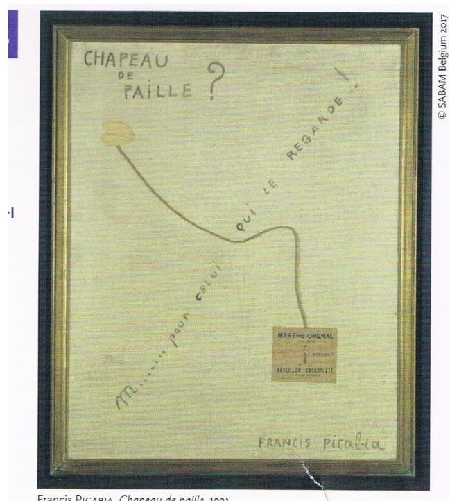
Francis PICABIA, Chapeau de paille , 1921