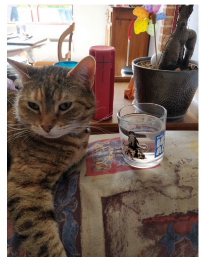
Mais qu'est-ce que je fais là moi ?...