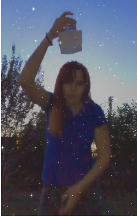
La star !