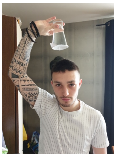
Attention au petit bout de papier...moi ça m'a joué des tours ;-)