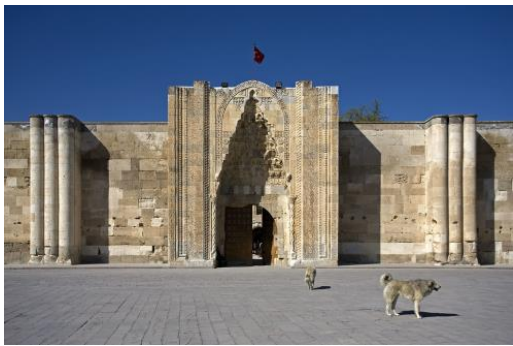
Sultanhanı, caravansérail en Turquie, XIIIe siècle

A la suite de ta recherche, que retiendras-tu de ce caravansérail ?