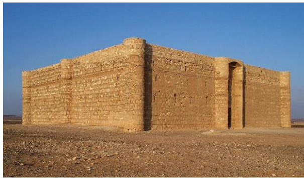
Qsar Kharana, Jordanie, VIIIe siècle

A la suite de ta recherche, que retiendras-tu du qsar Kharana ?