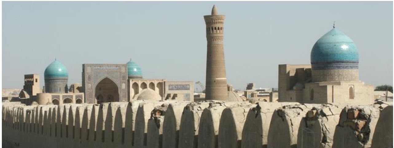
Ville de Boukhara en Ouzbékistan, Xe siècle

A la suite de ta recherche, que retiendras-tu de la ville de Boukhara ?