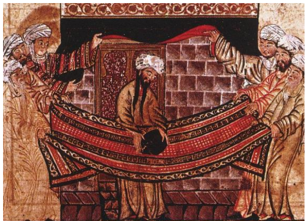
Illustration montrant Mahomet et la Kaaba, La Mecque en Arabie Saoudite, XIVE siècle

A la suite de ta recherche, que retiendras-tu de la kaaba ?