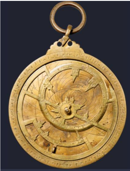
Astrolabe, Bagdad en Irak, Xe siècle

A la suite de ta recherche, que retiendras-tu de l'astrolabe arabe ?