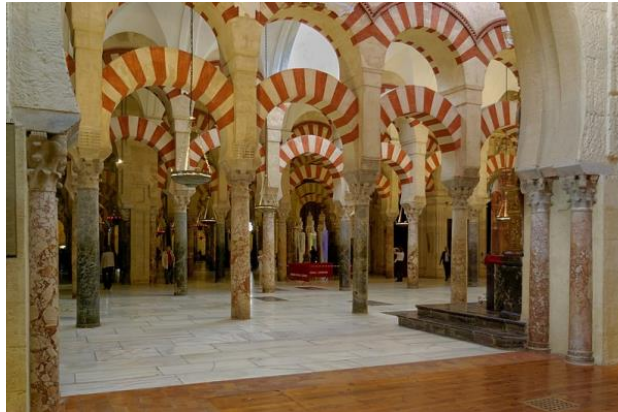
Salle de la mosquée-cathédrale de Cordoue, Espagne, VIII e siècle

A la suite de ta recherche, que retiendras-tu de la mosquée de Cordoue ?