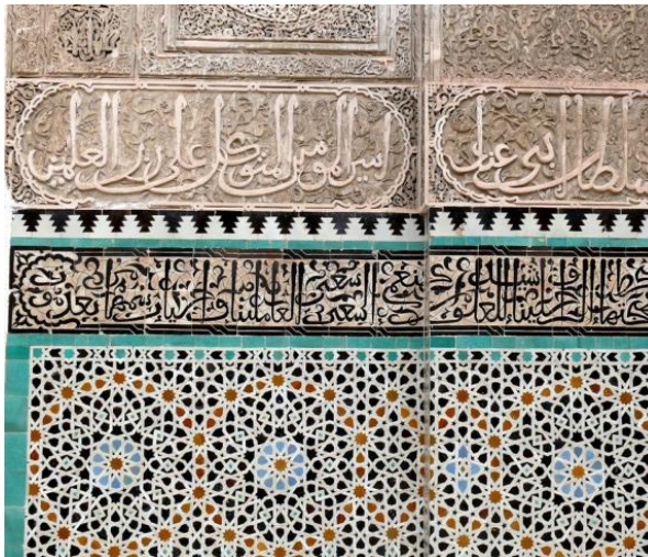
Zelige de la medersa de Fès au Maroc, XIVe siècle

A la suite de ta recherche, que retiendras-tu de la medersa de Fès ?