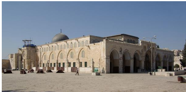
Mosquée Al-Aqsa,, Jérusalem en Israël, construite à partir du VIIIe siècle

A la suite de ta recherche, que retiendras-tu de la mosquée Al-Aqsa ?