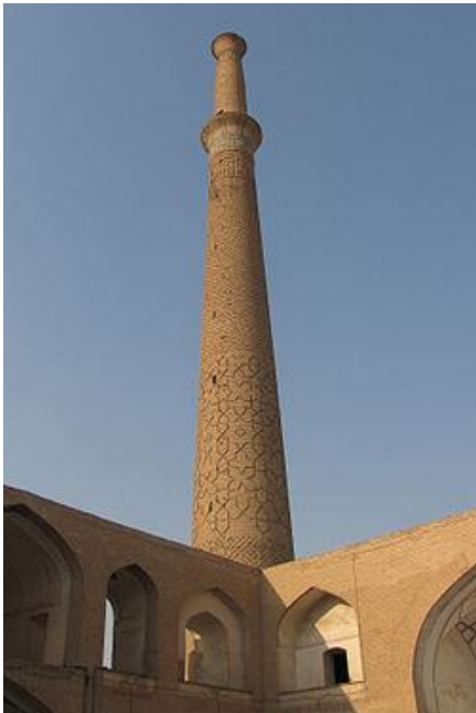
Minaret d'Ali, Ispahan en Iran, XIe siècle

A la suite de ta recherche, que retiendras-tu du minaret d'Ali ?