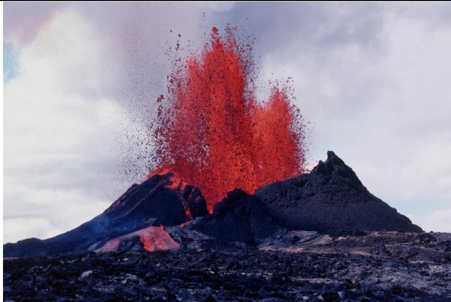
Document 11 : éruption du Kilauea en 1983

Localise le cratère et le cône volcanique sur la photo ci-dessous.